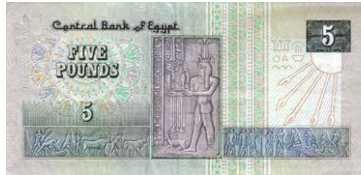
Der original ägyptische 5-Pounds-Geldschein und die künstlerische Detailwiedergabe von Paul Hartwig im Bild links.